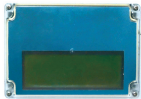
Рис. 4. Внешний вид макета мобильного беспроводного информационного пульта.