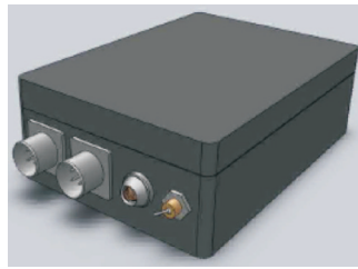
Рис. 2. Внешний вид РППМ для передачи данных с датчиков ГТИ.

данных (оцифровку аналоговых сигналов, обработку импульсных и цифровых сигналов с соответствующих датчиков). Радиомодем передает обработанные данные по радиоканалу на координатор радиосети.